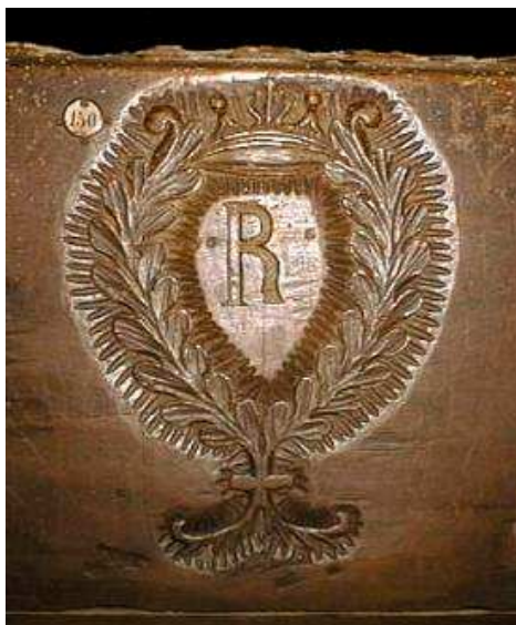
Banc armorié à Belvédère